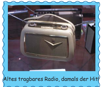
Altes tragbares Radio, damals der Hit!

Vandaag worden informatie / liedjes met microfoons opgenomen, via _____ uitgezonden en via de radio zo aangepast _____, dat muziek / gesproken tekst te horen is. Over de _____ kun je dan kiezen welke van de vele programma's je wilt horen.