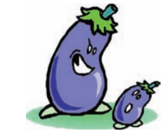
groot - klein