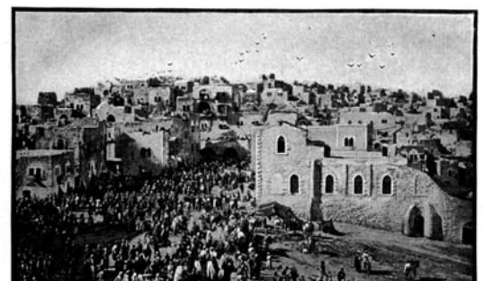
Vue de Bethléem en 1894.

Afin que le jeu devienne plus passionnant, vous pouvez inventer de nouvelles règles de jeu et inventer de nouvelles cartes