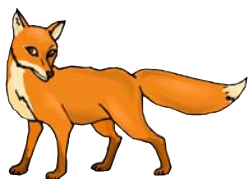
marcher à pas feutrés