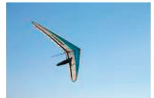
pour s'élever dans les airs