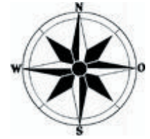
Rose des vents