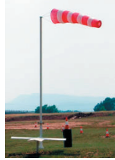
Manche à air