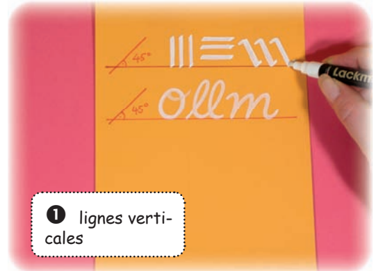
❶ lignes verticales

❹ Ecris les lettres avec entrain et laisse des espaces différentes entres les lettres. Mais vérifie bien que tu tiens toujours ton marqueur à un angle de 45°C .