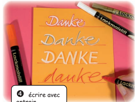
❹ écrire avec entrain