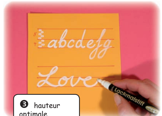
❸ hauteur optimale