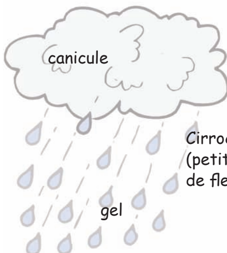
Cirrocumulus (petits nuages en forme de fleurs de coton !)