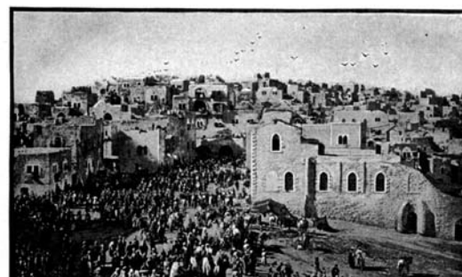
Zo zag Bethlehem er in 1894 uit.

Om het spannend te houden kan je zelf ook nieuwe spelregels en gebeurteniskaarten bedenken!