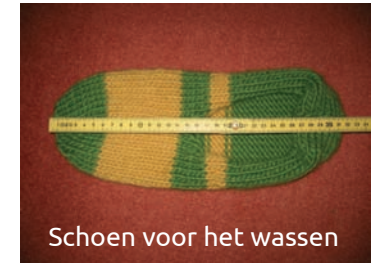
Schoen voor het wassen

Sprookjeswol is geschikt voor viltten met de naald of om nat te viltten. Viltwol wordt gebruikt om mee te breien of te haken en vervolgens in de wasmachine gevilt. Ze kan daarna gemakkelijk met een schaar worden afgeknipt.