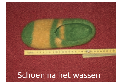
Schoen na het wassen