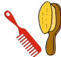
borstel en kam