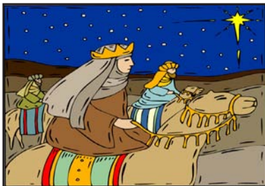
Männer Geschenke bringen