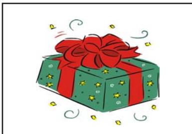
Geschenk verpacken Schleife

Der Vater und sein Sohn bauen einen Schneemann.