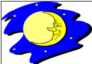
Mond scheinen Nacht

Ich verpacke das Geschenk und mache eine Schleife drauf.