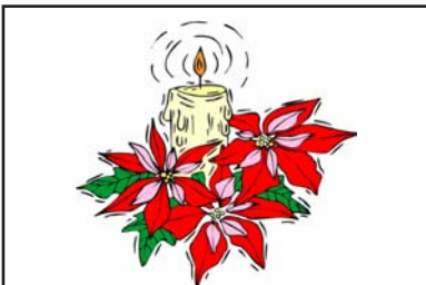
Kerze brennen hell