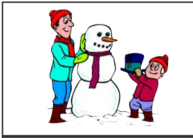
Vater und Sohn Schneemann bauen

Der Vater und sein Sohn bauen einen Schneemann.