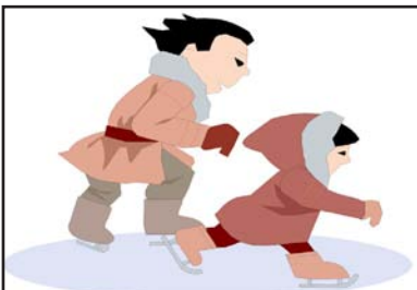
Die Kinder eislaufen See