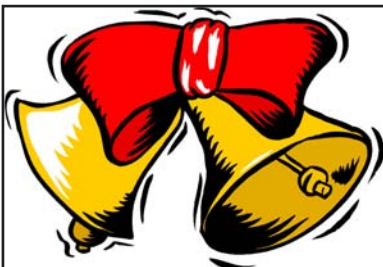
Glocken klingeln laut