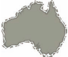
Australien + Ozeanien

Dieser Kontinent hat die kleinste Fläche.